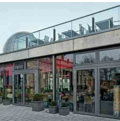
Schüco Aluminium-Türsystem ADS 75 HD.HI Schüco Aluminium door system ADS 75 HD.HI